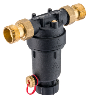
Q-ASTRO MAXI 1 1/4"