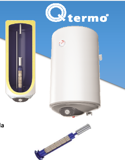
TREND 50 - 120 L