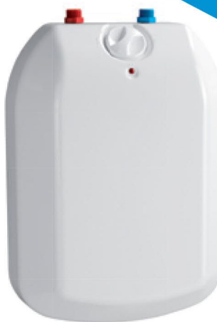
TREND 5 N