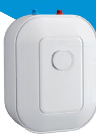
TREND 10 N