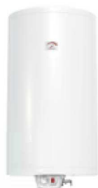
TREND 150 - 200 L