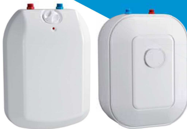
TREND 5 N